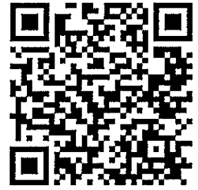
報名頁面 QR code