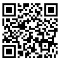
報名網站 QR CODE